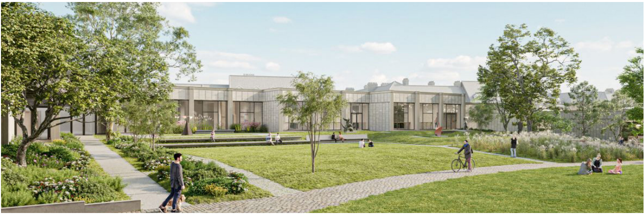
Projet de restructuration du jardin ouest du Quadrilatère, ©Chatillon Architecte