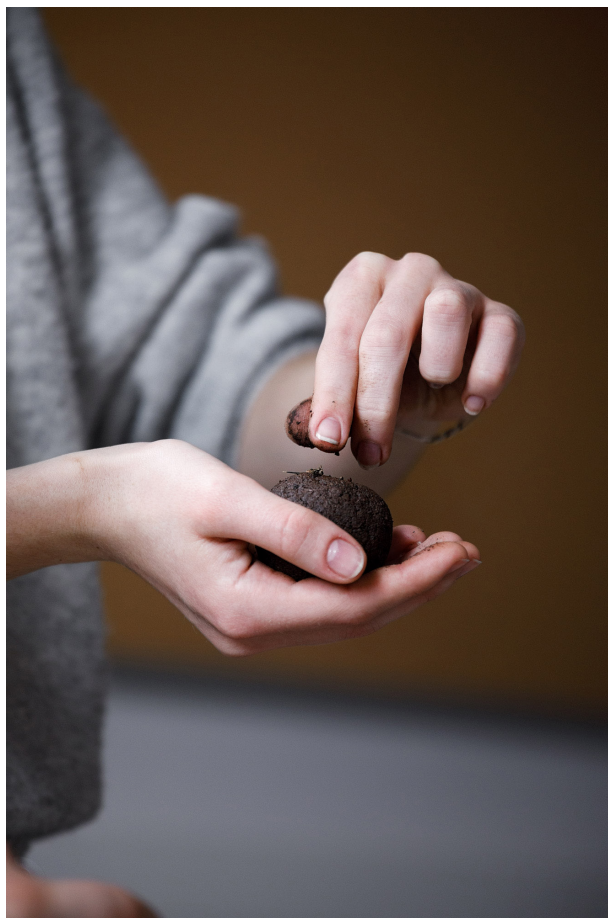
Caroline Le Méhauté, Négociation 140 - Tellus-Project Projet collectif de dépollution des sols, 2023

L'esthétique de l'œuvre est au croisement des meubles de campagne d'antan et du design minimaliste contemporain. Miroir de Tellus-Project , la Mangeoire se fait le réceptacle de bombes de graines d'un diamètre, cette fois-ci, bien plus conséquent (30 centimètres). Si les ateliers participatifs font des habitants le cœur du projet, les bombes installées dans le parc de la tour Boileau sont, quant à elles, dépendantes de leur environnement naturel. De mai à octobre, les aléas climatiques viendront progressivement altérer puis dégrader les bombes, laissant ainsi apparaître les graines contenues à l'intérieur. Une fois accessibles, ces dernières attireront de nombreux animaux dont l'activité et les déplacements transporteront naturellement les graines dans les environs.