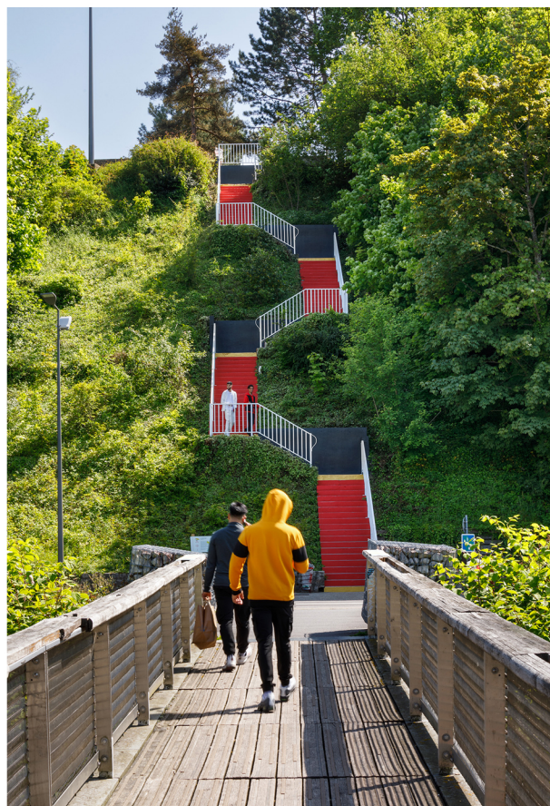
Caroline Le Méhauté, Négociation 142 - Le Contacteur, 2023 Photographie de Salim Santa Lucia ©Le Quadrilatère 2023

Ses œuvres sont présentées en résonance à la Triennale Art & Industrie - Dunkerque/Hauts-de France qui - sous le titre Chaleurs Humaines - fédère en 2023 un large réseau d'acteurs du champ des arts visuels de la Région autour de l'enjeu des transitions énergétiques. La résidence de Caroline Le Méhauté est également soutenue financièrement par la région Hauts-de-France