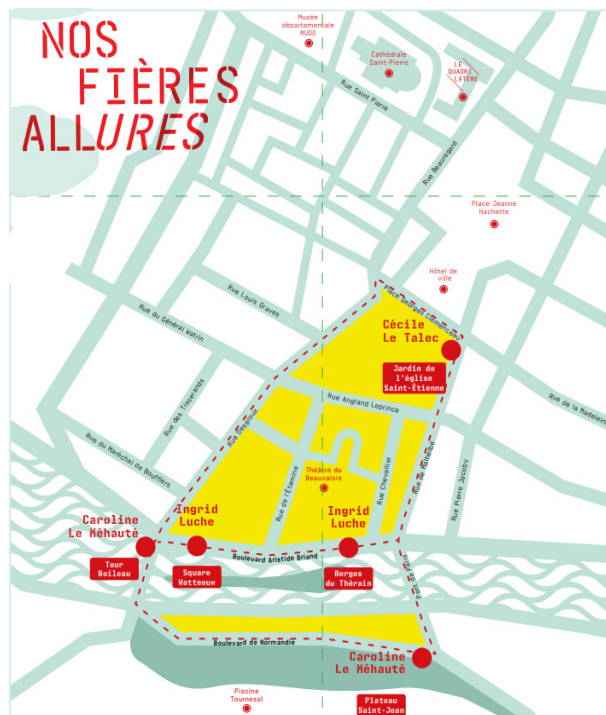
Carte du parcours Nos Fières Allures

L'exposition Nos Fières Allures est présentée dans le cadre de la programmation hors-les-murs du Quadrilatère pendant la durée du chantier de restructuration du Centre d'art.