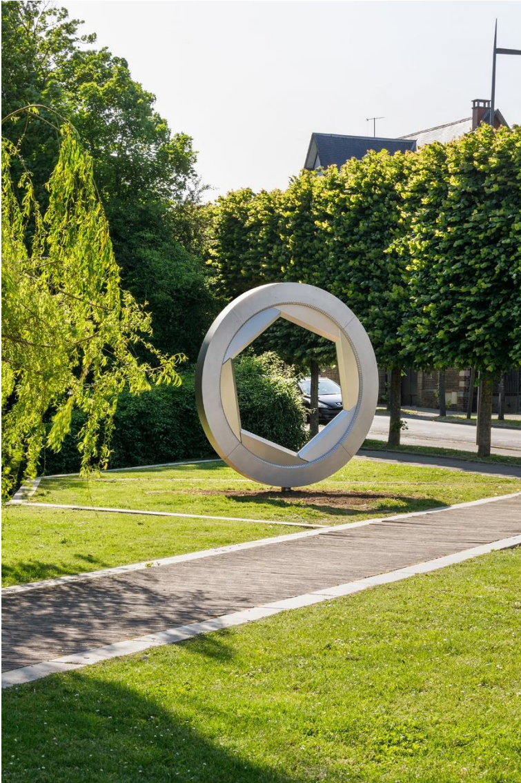
Ingrid Luche, La Porte-Sas , 300 cm, inox