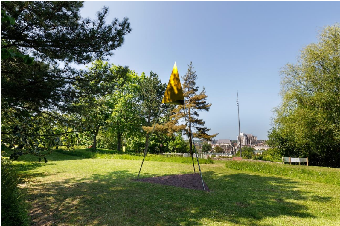
Caroline Le Méhauté, Le Relais , 2023 585 x 310 cm, inox, mylar, pouzzolane