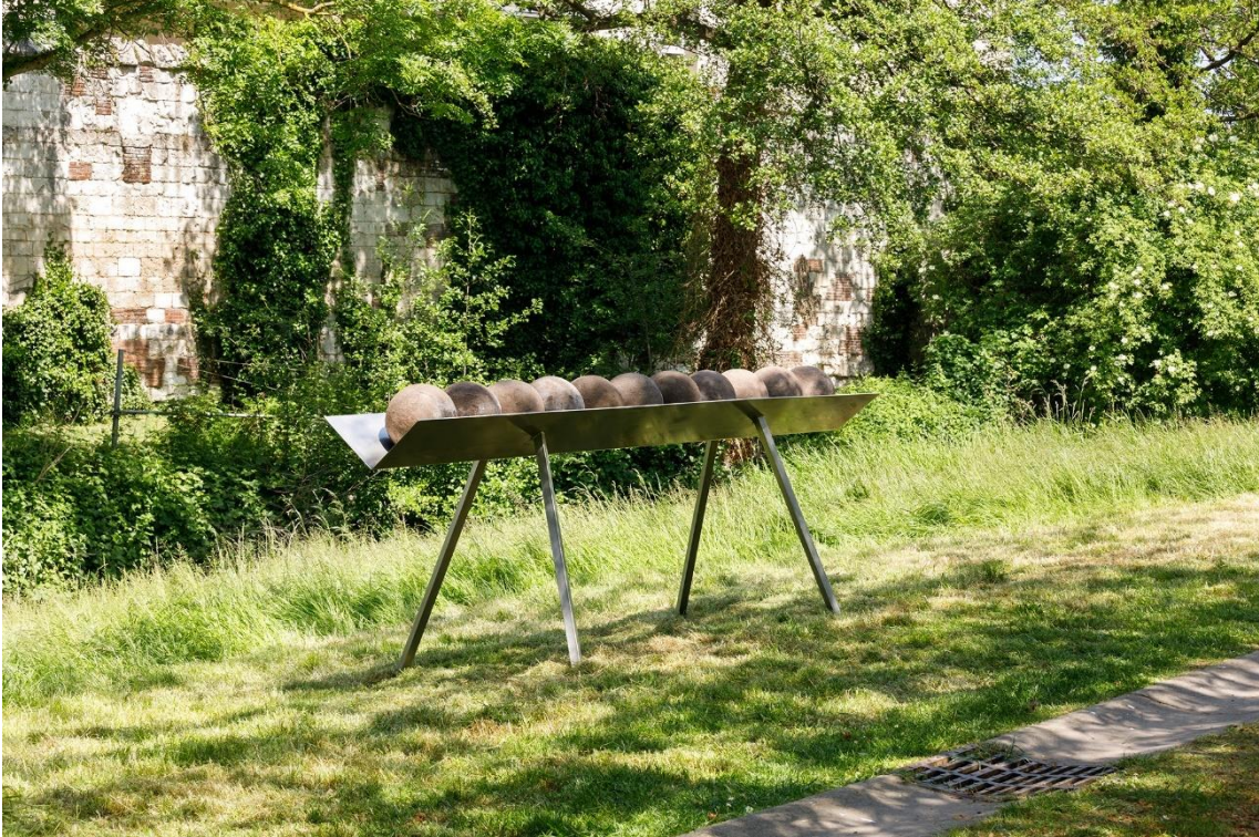
Caroline Le Méhauté, La Mangeoire , 2023 360 x 100 cm, tubes d'inox, terreau, argile, graines