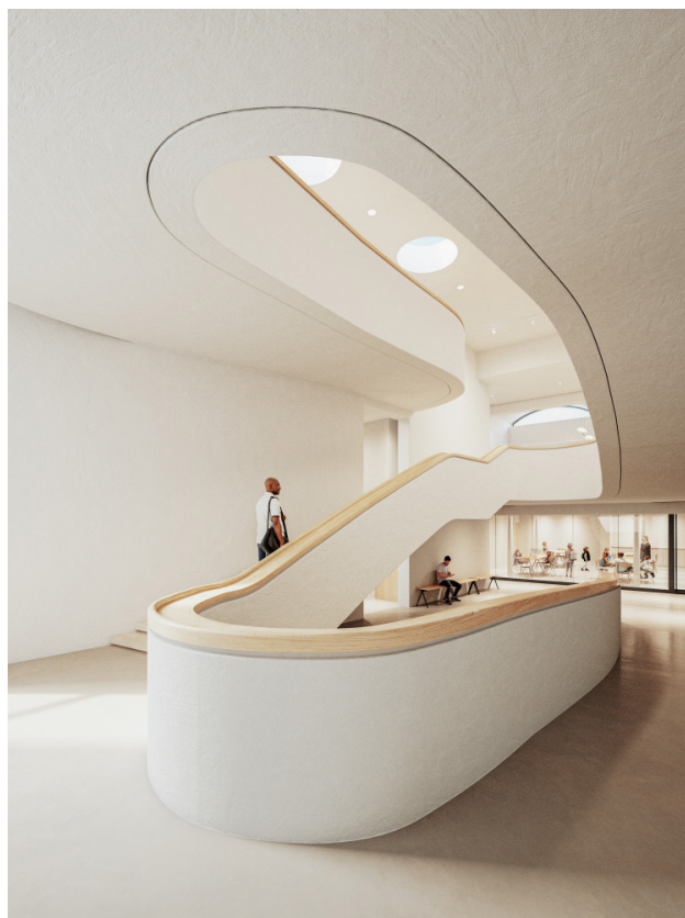
Projet du futur escalier du Quadrilatère

stratigraphiques. En mettant en lumière ces objets auparavant invisibles pour les visiteurs, cette intervention permettra d'enrichir les perspectives de la crypte afin de restituer le patrimoine de l'époque romaine. La récolte régulière de nouvelles informations offre également l'opportunité d'approfondir les connaissances déjà riches sur les différentes périodes d'occupation du sol.